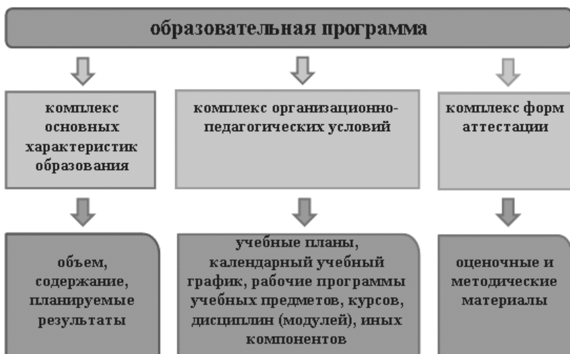
Состав определения образовательной программы

Если сопоставить определения, данные для образовательной программы образовательной организации и примерной основной образовательной программы, можно выявить несколько отличий.